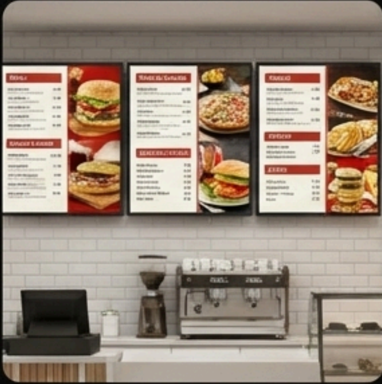
Menü Board Sistemleri

Yüksek talep gören dijital ekran çözümleri.