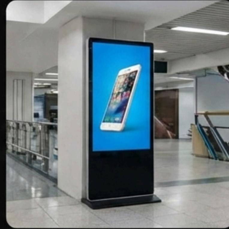
İç Mekan Reklam Ekranları