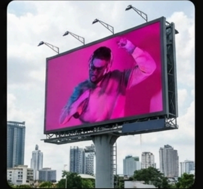
Outdoor Billboard Sistemleri