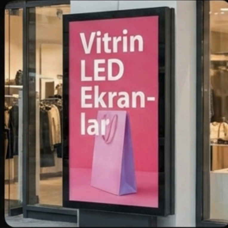
Vitrin LED Ekranlar