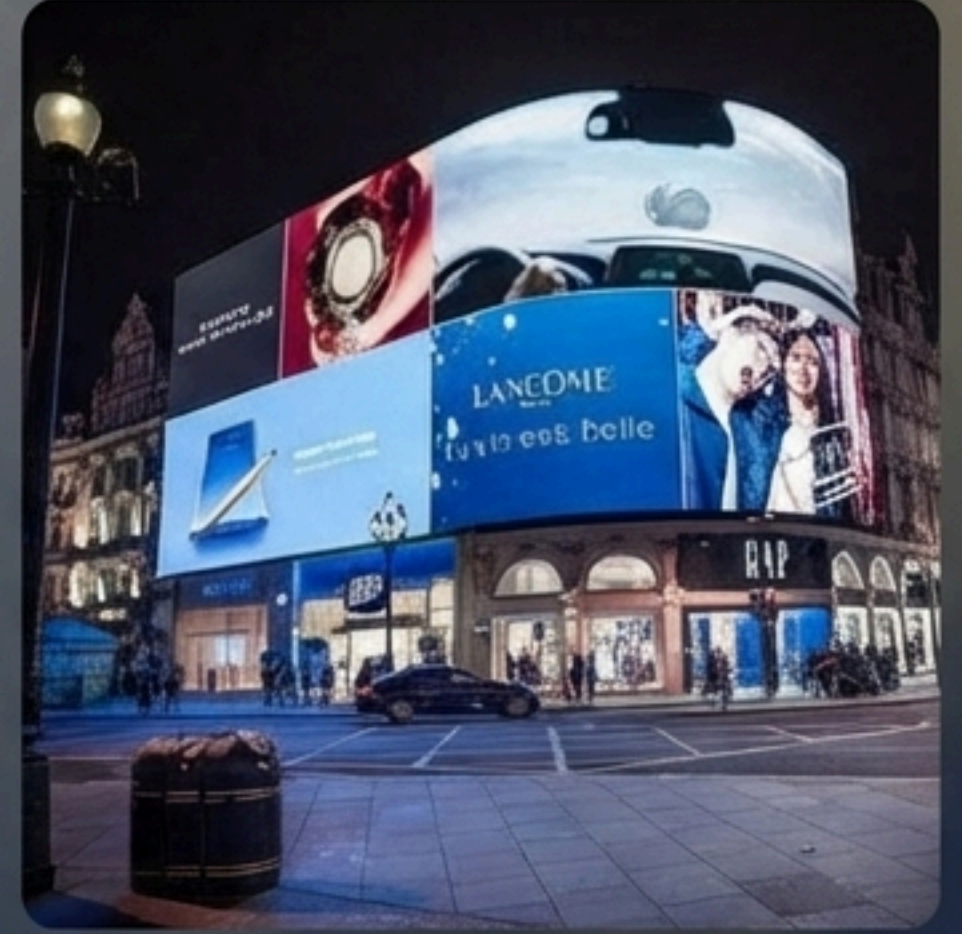
Dijital Signage & Özel Projeler (AVM, Kurumsal binalar ve zincir markalar).

“ Görünmeyen marka yoktur. Her işletme sizin potansiyel müşterinizdir.