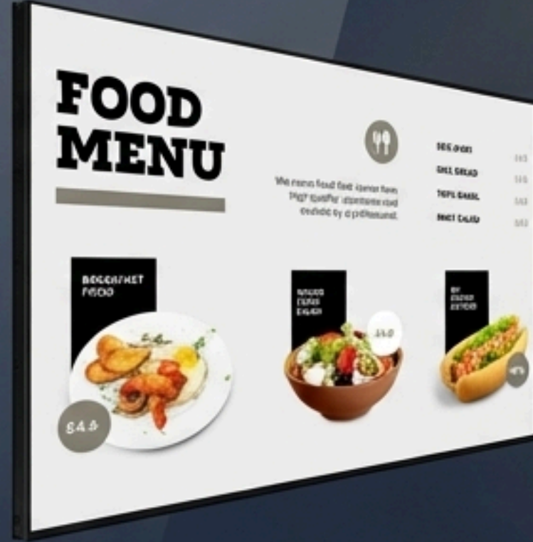
Vitrin LED Çözümleri (Satışı artıran doğrudan müşteri etkileşimi).